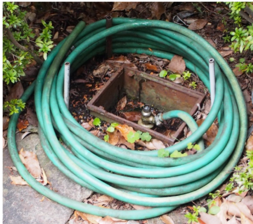
プラザ21玄関前階段横での散水栓(各棟入口付近にもある水道蛇口)からの給水訓練およびB棟地下の受水槽からの給水訓練