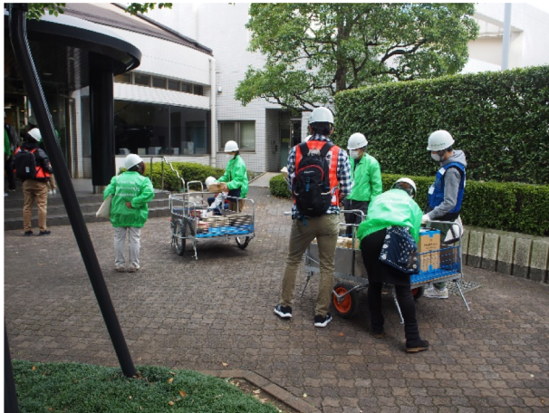
地域防災拠点より緊急時対策本部へ食料品等の搬送訓練