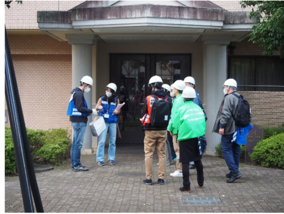
安否確認訓練のA-3エントランス開始。2チームに分かれてスカーフの提示状態を確認